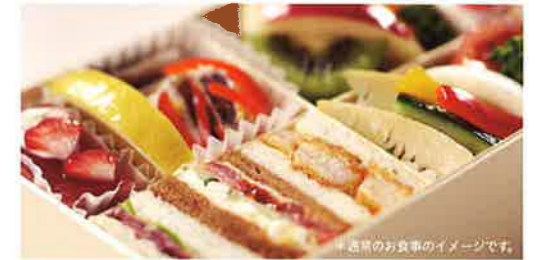
*通常のお食事のイメージです。

ひと息つきたい時や少し空腹を感じた時、またアルコールのおともにも。お食事とお食事の合間の時間帯には、どなたにもお楽しみいただける軽食をご用意しています。お寿司やサンドイッチをはじめ、サラダ、フルーツ、デザートなどを手軽にお召し上がりいただけます。