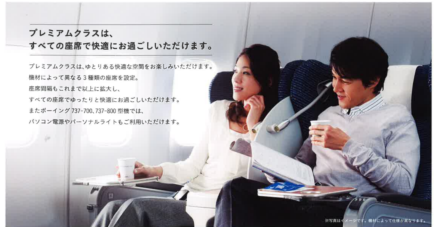
※写真はイメージです。機材によって仕様が異なります。

プレミアムクラスは、ゆとりある快適な空間をお楽しみいただけます。 機材によって異なる3種類の座席を設定。 座席間隔もこれまで以上に拡大し、 すべての座席でゆったりと快適にお過ごしいただけます。 またボーイング737-700、737-800型機では、 パソコン電源やパーソナルライトもご利用いただけます。