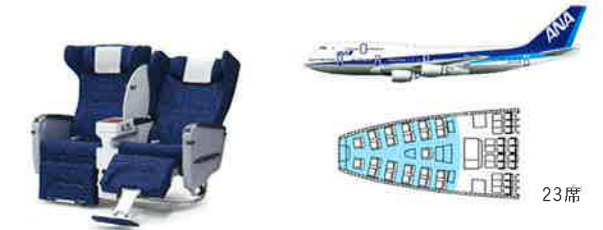
※各機材のシート及び配列図はイメージです。