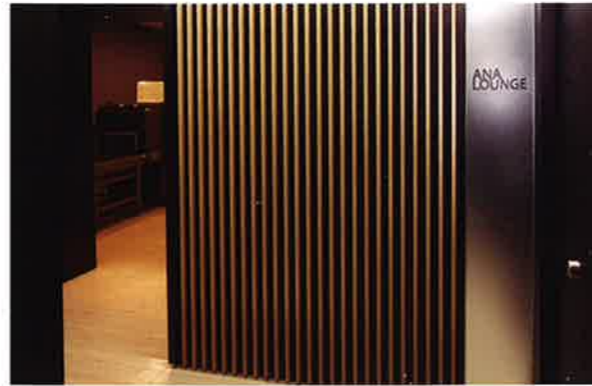
※写真は新千歳空港のイメージです。