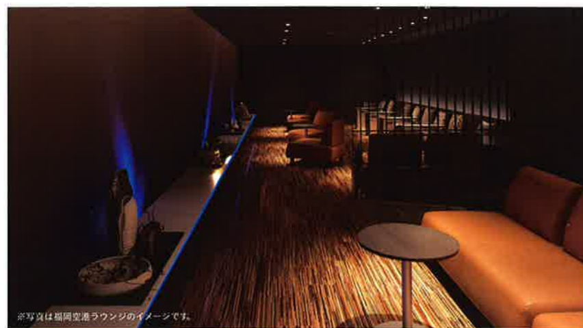
※写真は福岡空港ラウンジのイメージです。

羽田・新千歳・伊丹・福岡の4空港では、 設備の整ったつろぎの空間でご出発前からおゆっくりお過ごしいただけます。