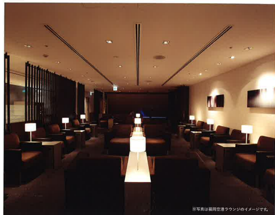
※写真は福岡空港ラウンジのイメージです。

どなたにもぎっとご満足いただける、 国内最高峰の空の旅。 ANAのプレミアムクラスで心ゆくまで。